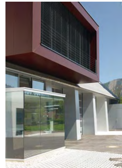
Feuerwehrzentrum Planung Robert Oberbichler Baujahr 2009