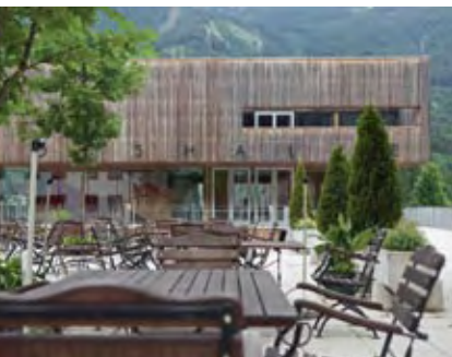
Hösshalle Planung Riepl Riepl Architekten Baujahr 2002

Im Zuge der Erstellung des Ortsentwicklungskonzeptes war schnell klar geworden, dass die Gemeinde eine Veranstaltungshalle brauchte – einerseits für die gemeindeeigenen kulturellen Aktivitäten, andererseits als Pressezentrum für den Ski-Weltcup, der seit 1986 alle paar Jahre in Hinterstoder Station macht. Im Vorfeld der Bauplanung wurden deshalb alle Vereine eingeladen, ihre Wünsche und Bedürfnisse bekanntzugeben. Danach erfolgte ein geladener Wettbewerb mit fünf Architekturbüros, die sehr unterschiedliche Entwürfe für die Veranstaltungshalle abliefern. Die Architekten hatten dann je 20 Minuten Zeit, dem Gemeinderat ihre Entwürfe zu erklären. Danach wurde sofort abgestimmt – ohne Fachjury. „Wir haben uns das zugetraut“, sagt Bürgermeister Wallner, „weil durch die vielen Projekte, die wir schon gemacht haben, auch in den Köpfen eine Entwicklung stattgefunden hat. Deshalb haben wir gesagt: ‚Es ist unser Bau, das wollen wir